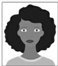
Figura 1. Modelo de Foto Frontal